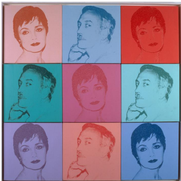
Andy Warhol, Portraits, 1980