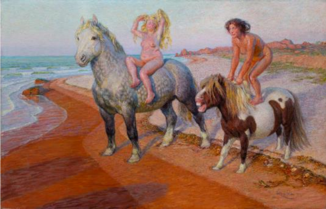
Balada (Radosti života), 1901–1902, olej, dřevo, 83,5 x 126,5 cm, Národní galerie Praha Žigolety