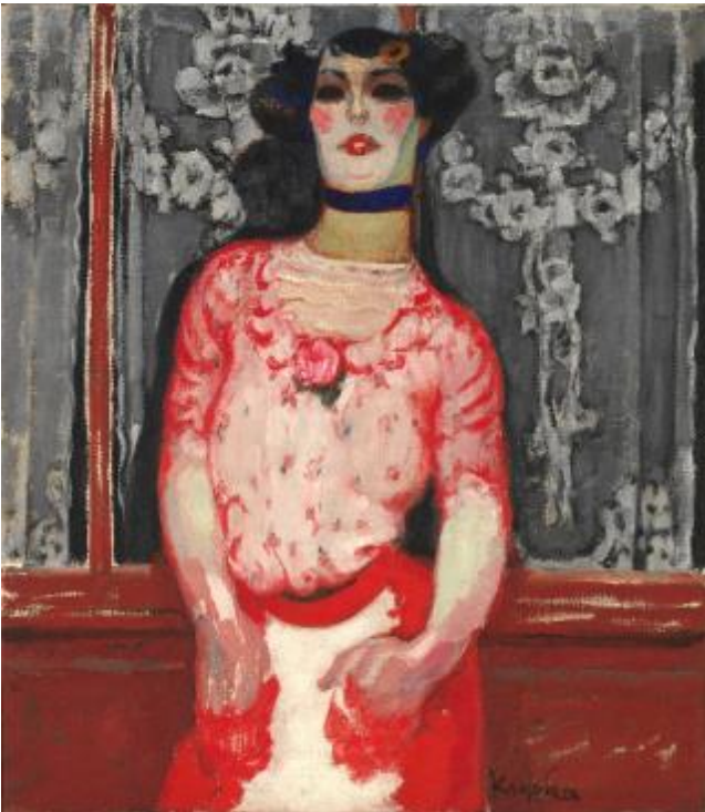
Ženská pro Galliena (Gallienovo gusto, Herečka z kabaretu), 1909, olej, plátno, 108 x 100 cm, Národní galerie Praha