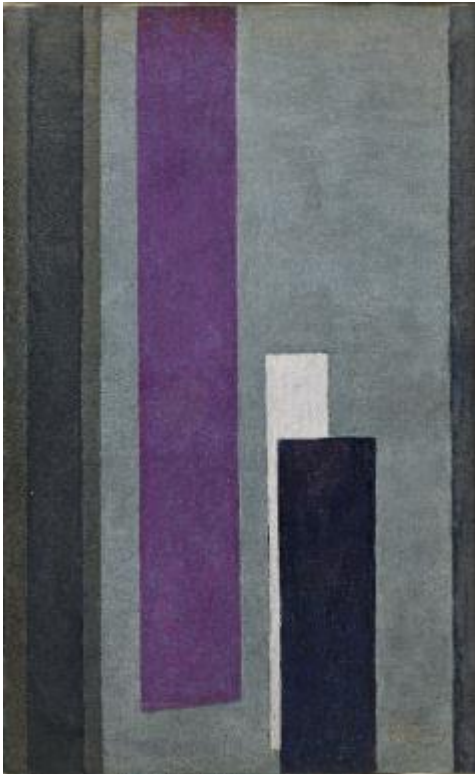
Vertikální plány III, 1912–1913, olej, plátno, 200 x 118 cm, Národní galerie Praha