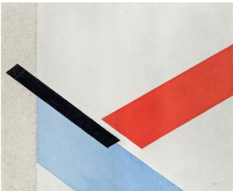
Diagonální roviny, 1931, olej, plátno, 90 x 110 cm, Národní galerie Praha