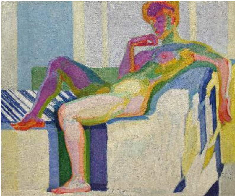
Velký akt (Plochy podle barev), 1910, olej, plátno, 150,1 x 180,8 cm, Guggenheim, New York