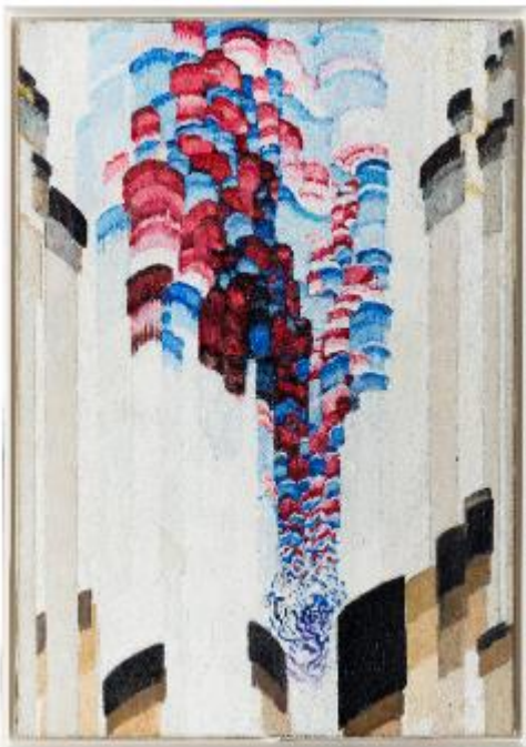
Tryskání II (Víření), 1923, olej, plátno, 121 x 83 cm, Národní galerie Praha