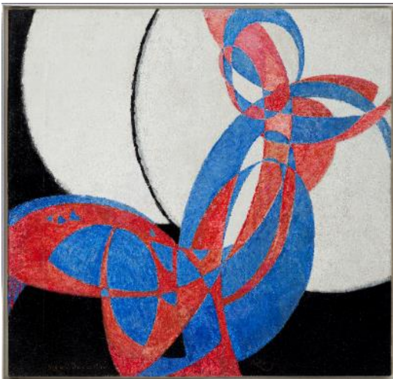
Amorfa. Dvojbarevná fuga, 1912, olej, plátno, 211 x 220 cm, Národní galerie Praha