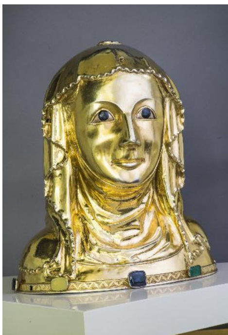
Herma sv. Ludmily z 1. třetiny 14. století, Metropolitní kapitula u sv. Víta

Příběh vzájemných vztahů začíná již v době kamenné ukázkami hrnčířského a šperkařského řemesla. Výstava provádí návštěvníka dobou bronzovou, železnou i obdobím stěhování národů. Nejstarší období jsou na výstavě zastoupena zcela ojedinělými předměty – např. unikátními nálezy z pohřebiště v Praze-Zličíně z 5. století našeho letopočtu.