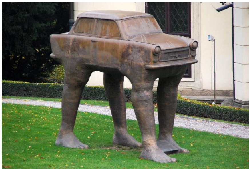
David Černý, Quo Vadis , 1990, zahrada Velvyslanectví Spolkové republiky Německo v Praze