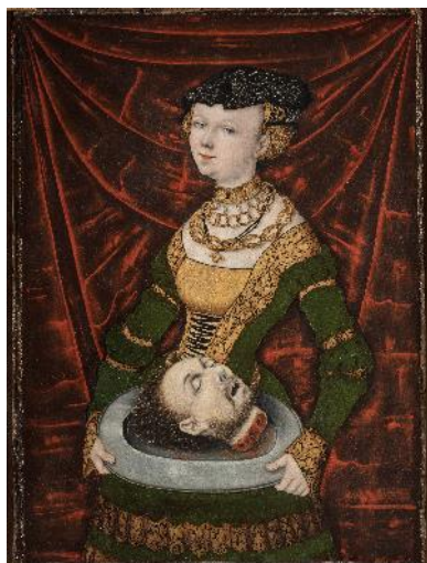
Mistr IW, Salomé s hlavou sv. Jana Křtitele, kolem 1525, NGP