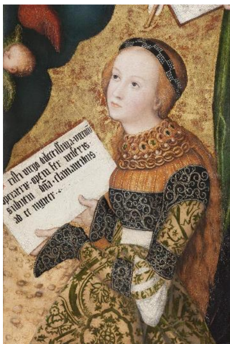
Lucas Cranach st., Sv. Kristina, kolem 1520, NGP