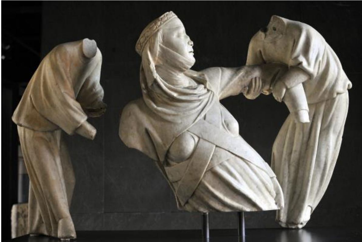
Fragmente des Grabmals der Königin Margarethe von Brabant, Giovanni Pisano, 1313–1314, Carrara-Marmor, Fassungsreste, Genua, Galleria Nazionale di Palazzo Spinola

In der Nacht vom 13. auf den 14. Dezember 1311 erlag Margarethe, Gemahlin Kaiser Heinrichs VII. und Großmutter Karls IV., in Genua der Pest, mit der sie sich bei der Belagerung von Brescia im selben Jahr angesteckt hatte. Sie wurde in der Minoritenkirche San Francesco di Castelletto in der Nähe des Hochaltars beigesetzt. Bei einem seiner Aufenthalte in Pisa beauftragte Kaiser Heinrich VII. den damals bereits berühmten Bildhauer Giovanni Pisano (um 1250–1314), seine verstorbene Gemahlin mit einem prunkvollen Grabmal zu ehren. Von dem zweigeschossigen Grabmal sind lediglich die Figurengruppe der Seelenerhebung (elevatio animae), die Allegorie der Gerechtigkeit (Iustitia) und einige weitere Figurenfragmente erhalten geblieben.