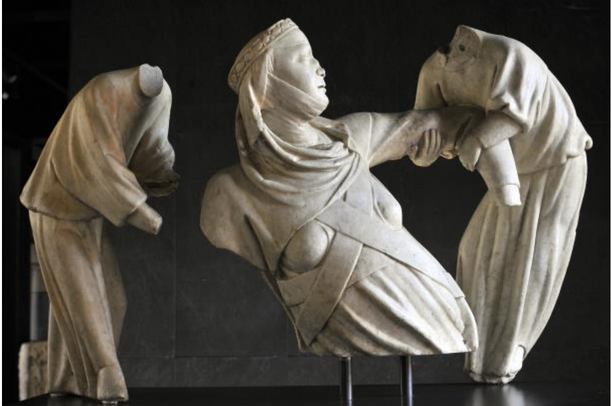
Fragmenty náhrobku královny Markéty Brabantské, Giovanni Pisano, 1313–1314, carrarský mramor, fragmenty polychromie, Janov, Galleria Nazionale di Palazzo Spinola

Náhrobek královny Markéty Brabantské zobrazuje vyzdvižení její duše na nebesa. Dva andělé pomáhají duši královny Markéty vystoupat do nebeské sféry. Duše je znázorněna v tělesné podobě a na hrudi má překříženou štolu, znak svatosti. Hlava otočená ke straně s lehce otevřenými rty hledí k nebeskému Jeruzalému. Vynesení duše zemřelého člověka anděly do nebes k věčné spáse bezprostředně po smrti bylo podle středověké eschatologie vyhrazeno pouze zesnulým, kteří vedli obzvláště zbožný život téměř na prahu svatosti.