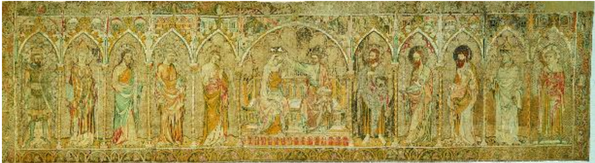
Antependium s Korunováním Panny Marie z mariánského kostela v Pirně, Praha, před rokem 1350, len, výšivka, Kunstgewerbemuseum

Precizně provedená výšivka vznikla v Praze v jedné z hlavních vyšivačských dílen s těsnými vazbami na královský dvůr. Antependium je tkanina pokrývající přední stranu oltářní menzy. Exemplář z Pirny, který v letech 1294 až 1405 patřil české koruně, představuje výjimečně kvalitní doklad luxusního vyšivačského řemesla. Kompozice antependia vyniká jemným odstíněním barev, plasticitu obrazu dodává střídání směru kladení hedvábných nití.