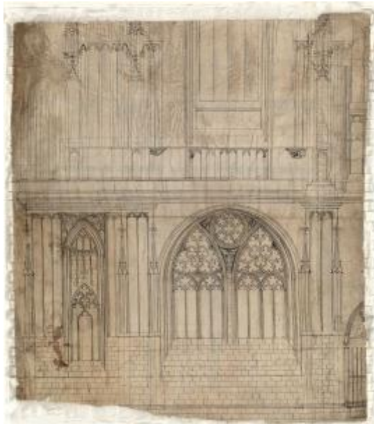
Architektonická kresba jižní věže katedrály sv. Víta, Petr Parlér, kolem roku 1365, pergamen, černá tuš, Vídeň, Akademie der Bildenden Künste, Kupferstichkabinett

Kresba představuje návrh Petra Parléra na výstavbu přízemí velké věže, která z boku chrání jižní průčelí pražské svatovítské katedrály. Petr Parlér zde zamýšlel jako dominantní prvek velké okno zaujímající celou plochu stěny mezi opěrnými pilíři a zasazené v obloukovém výklenku. V návrhu vyniká množství kružbových vzorů, které se skládají ze stále nových a nových variant otevřených listů a plamének a podtrhují tak originalitu i bohatství elegantního dekoru.