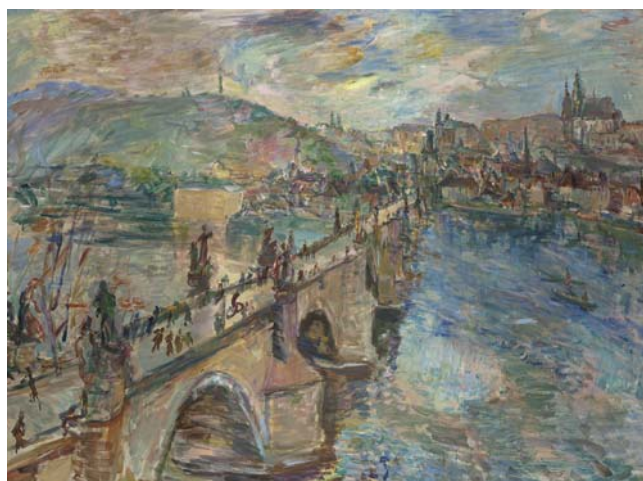
Praha. Pohled na Karlův most od křižovnického kláštera, 1934