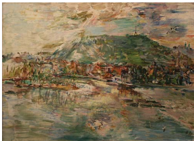
Praha. Pohled z břehu Vltavy na Malou Stranu a Petřín I, 1936 Kunstforum Ostdeutsche galerie Regensburg