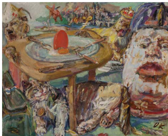
Červené vejce, 1941 Národní galerie v Praze

Cena: základní 80 Kč, snížená 50 Kč (zahrnuje vstupné a poplatek za odborný výklad) / Doba trvání: cca 60 min. / Místo setkání: pokladny v přízemí Veletržního paláce