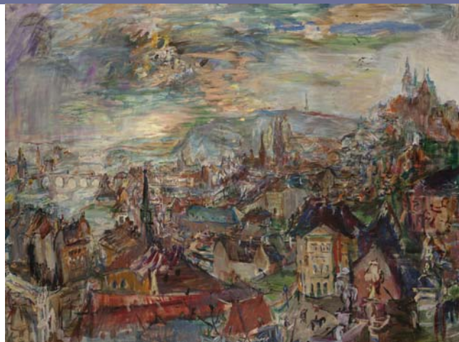
Pohled ze Strahova, 1934 Fondation Oskar Kokoschka, Vevey

Tyto a další studijní materiály jsou k dispozici ke stažení zdarma na: http://www.ngprague.cz/cz/1085/sekce/studijnimaterialy/