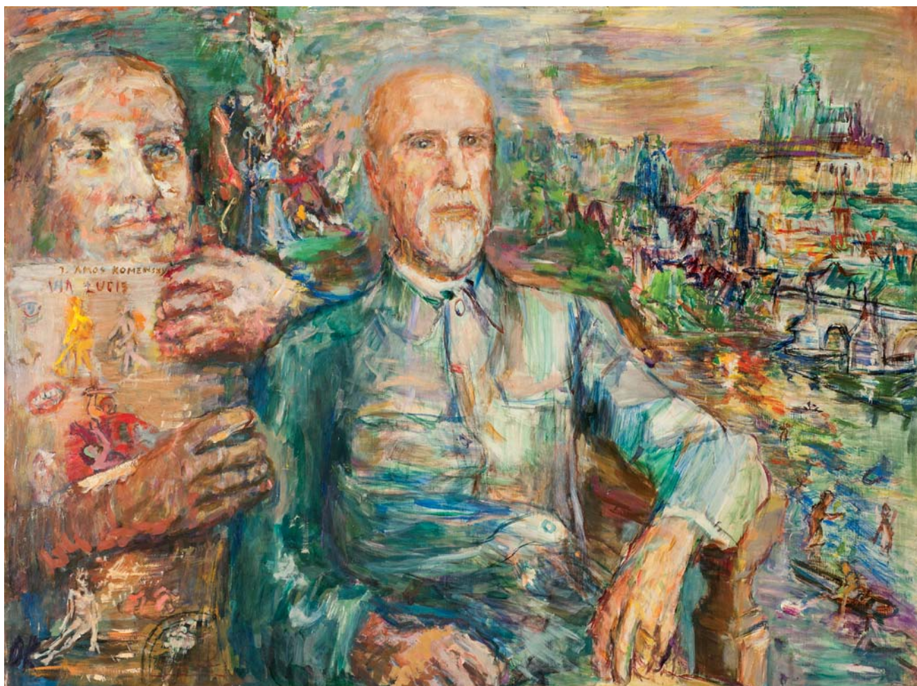
Portrét Tomáše Garrigua Masaryka, 1935–1936 Carnegie Museum of Art, Pittsburgh, Patrons Art Foundation