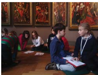
Velikonoce, to není jen pomlázka — o původu a symboech Velikonoc (program pro ZŠ)

autoři děl: Andrea della Robbia, J. Gossaert zv. Mabuse, J. Ribera, Luca Giordano. P. P. Rubens