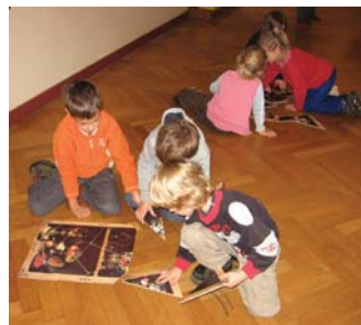
Všechny krásy světa (program pro MŠ)