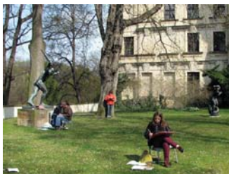
Zátiší, krajinomalba, žánrový obraz (program pro SŠ)